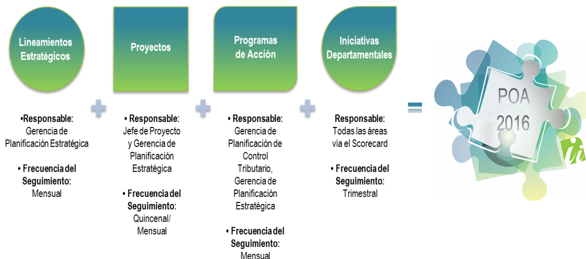
Gráfico VI.I: Seguimiento al POA 2016