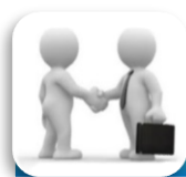
Gráfico III.I Objetivos Generales y Específicos por Eje Estratégico

El POA consolida las acciones concretas a realizar para dar cumplimiento a los Objetivos definidos en el Plan Estratégico y a los Objetivos Específicos Cuantitativos planteados para el próximo año. Por este motivo, cada iniciativa presentada durante las Jornadas de Planificación debe estar alineada con el logro de los mismos.